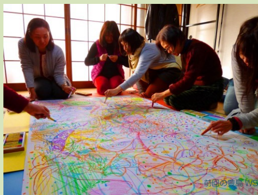
前回のワークショップ