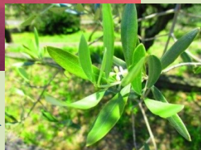
小豆島のオリーブ